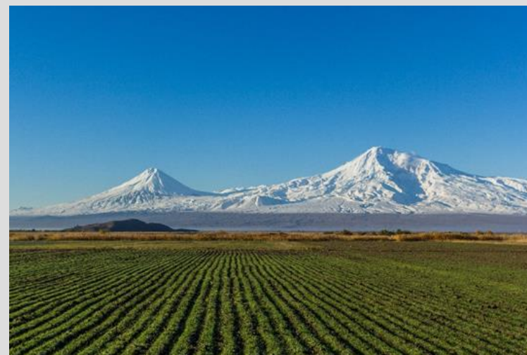
De berg Ararat